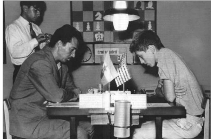
Gligoric - Fischer