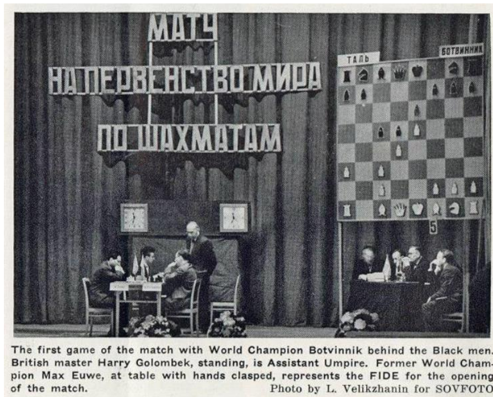
The first game of the match with World Champion Botvinnik behind the Black men. British master Harry Golombek, standing, is Assistant Umpire. Former World Champion Max Euwe, at table with hands clasped, represents the FIDE for the opening of the match.

Tal a les Blancs dans les parties impaires