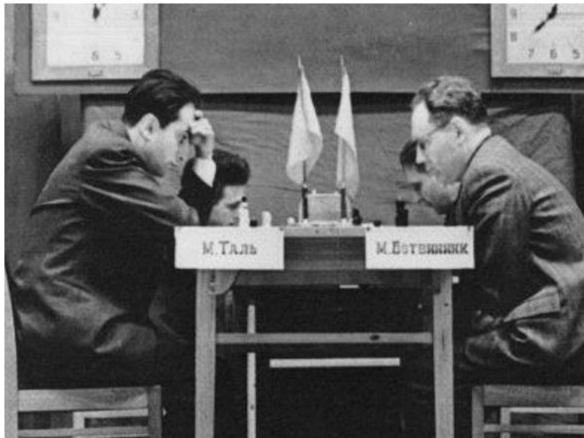
Tal and Botvinnik, 1960