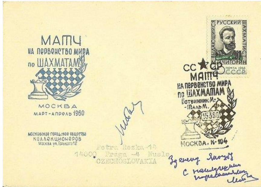
Autographe de Tal