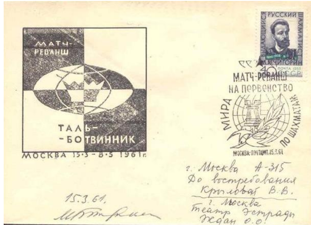
Signature de Botvinnik