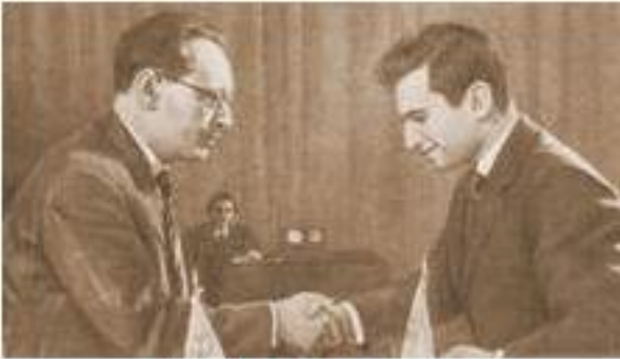
Tal and Botvinnik, 1961

Botvinnik a les Blancs dans les parties impaires