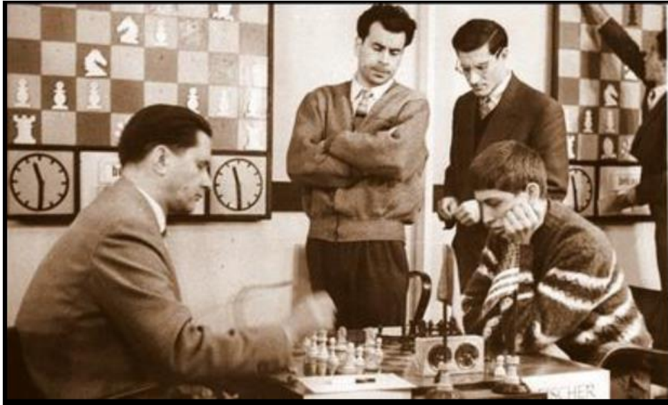
Kérés – Fischer